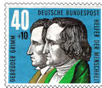
„Jakob und Wilhelm Grimm“ auf Wohlfahrtsmarken 1959