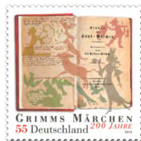
Sondermarke „200 Jahre Grimms Märchen“ 2012